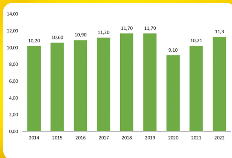
Figura 1. Evolución del % de penetración de usuarios de centros Fitness en España 2014-2022.

sonas en 2021, al 11,3% a finales de 2022, 5,4 millones de personas. Aún así el tanto por ciento de penetración de usuarios de centros Fitness en España, sigue siendo 0,4 puntos porcentuales menor que en el 2019.